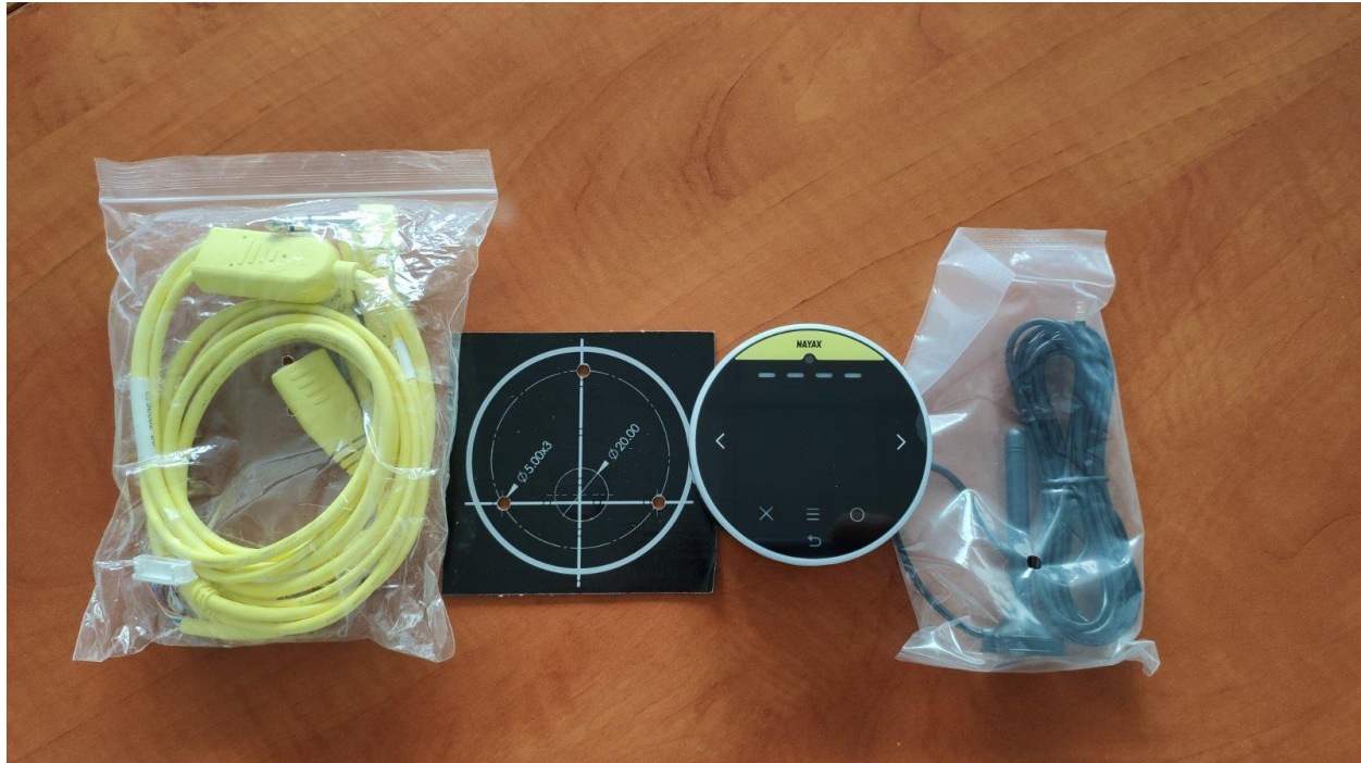
Nayax kábel – Felfúró sablon – Nayax készülék - Antenna